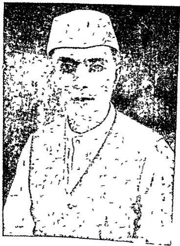
पं० जवाहरलाल नेहरू